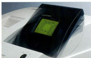
Das LCD-Display, schwenkbar