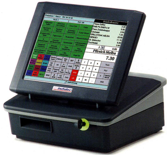
Abbildung: INKA 440 mit Bondrucker